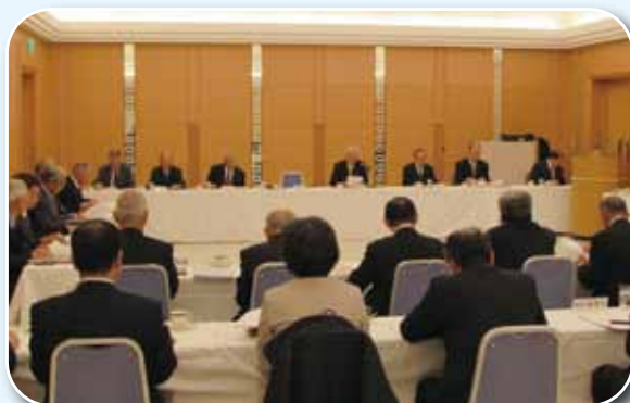
臨時理事会の開催状況

理事会の承認を受けて千葉県に対し変更認定申請を行い、12月28日認定を受けました。