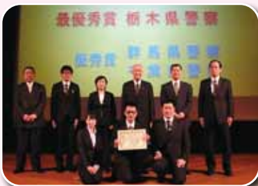
▲優秀賞の千葉県警チーム