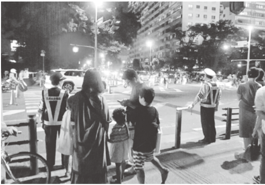
四 街 道