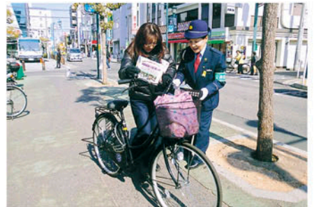
行徳 行徳駅前では自転車利用者に啓発物を配る。