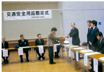
茂原 新入学児童を対象に第22回交通安全用品贈呈式を行う。