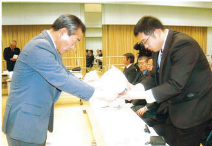
館山 管内8中学校の新生入生に自転車用ヘルメット等を贈る。