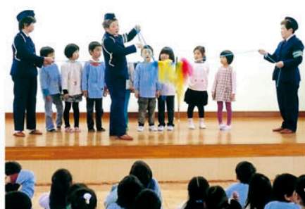
一宮 一宮保育所で交通安全教室を開き啓発する。