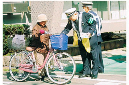
市川 市役所前道路で自転車利用者に安全利用を呼びかける。