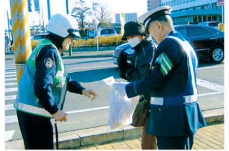
鎌ヶ谷 イオン鎌ヶ谷店前で通行人に啓発物を配る。