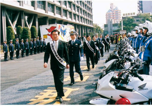
整列した参加者を巡検する県知事と代表者