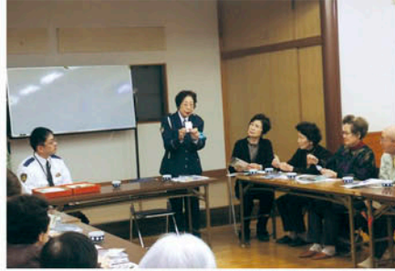
松戸東 馬橋第六長寿会員の安全教室で反射材などを配る。