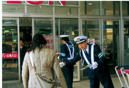
印西 イオンモールで啓発物を配り事故防止を訴える。