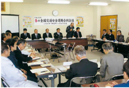
いすみ 大原庁舎会議室で春の安全運動を前に合同会議を開く。

交通安全協会の活動にご協力いただきありがとうございます。会員の皆様の会費は、地元の交通安全協会の交通安全ボランティア活動に活用されています。