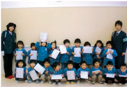
鴨川 長狭幼稚園の卒園児に記念品を贈る。