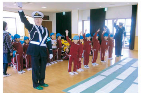
浦安 浦安保育園で横断歩道の渡り方等を指導する。