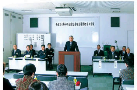
松戸 西部防災センターで春の交通安全運動打合せ会を開く。