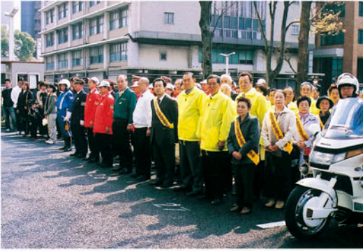
交通関係者が多数出席して

先頭に県警音楽隊がパレードをした後、白バイのエンジンがかかれ、参加者が拍手で見送る中、運動の始まりを周知する街頭広報活動に出発して行きました。