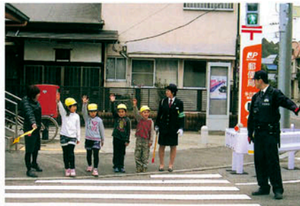
多古町 町立中央保育所周辺で横断歩道の渡り方を指導する。