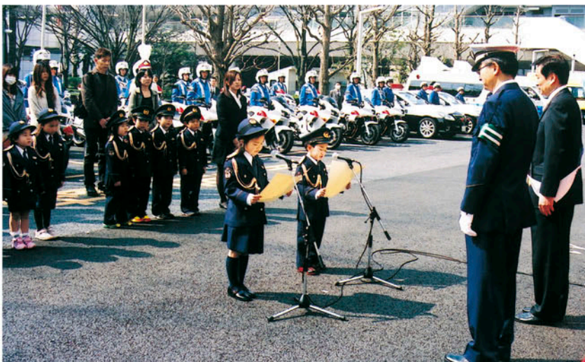
『交通安全の誓い』を読む「はまの幼稚園」の園児