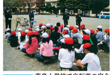
千葉北 花鳥小学校で自転車の安全な乗り方を指導する。