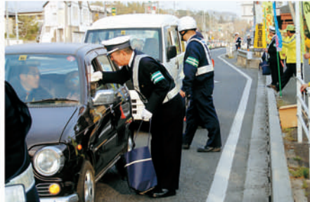
市原 山木地区等の交差点で啓発物を配り安全運転を訴える。