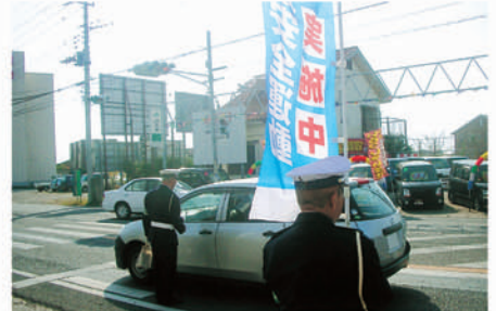
匝瑳 市役所前の国道126号で啓発活動を行う。