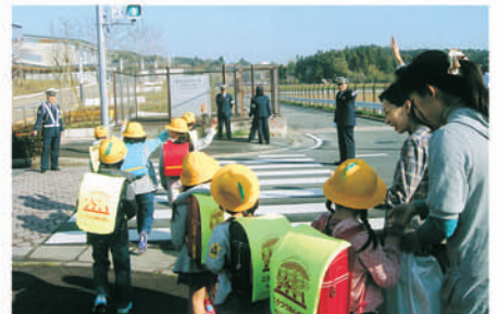
東金 大網小学校前で新学期の保護誘導活動を行う。