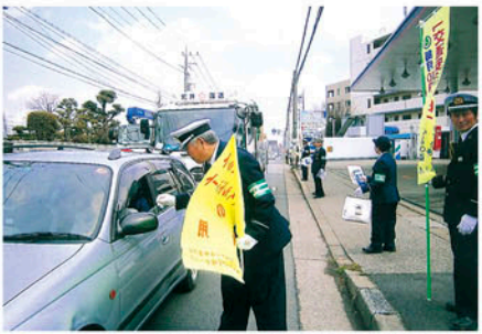
松戸 消防局前交差点で啓発物を配り安全運転を呼びかける。

交通安全協会の活動にご協力いただきありがとうございます。会員の皆様の会費は、地元の交通安全協会ボランティア活動に活用されています。