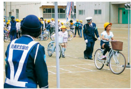
千葉中央 蘇我小学校で自転車の安全な乗り方等を指導する。