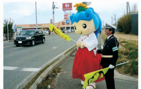
一宮 町のキャラクター「いっちゃん」も参加して啓発活動。