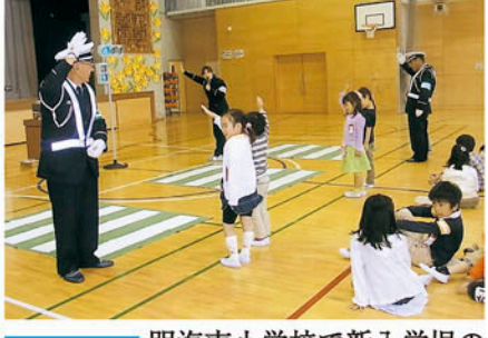
浦安 明海南小学校で新入学児の交通安全教室を開催する。