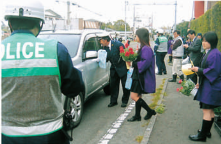
千倉 和田町の幹線道路で地元高校生が育てた花を配る。