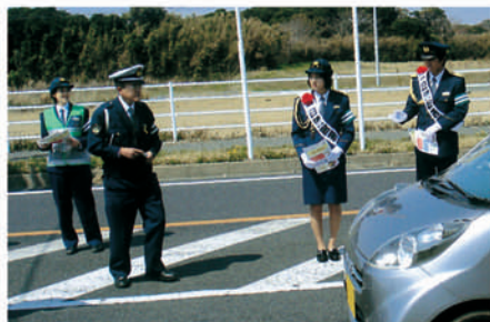
富津 一日警察署長が街頭活動キャンペーンで啓発する。