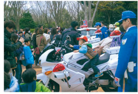
千葉東 千葉市動物公園で白バイ等の乗車体験で啓発する。