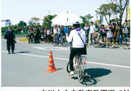
行徳 市川中央自動車教習所で外国人学生の安全教室を開く。