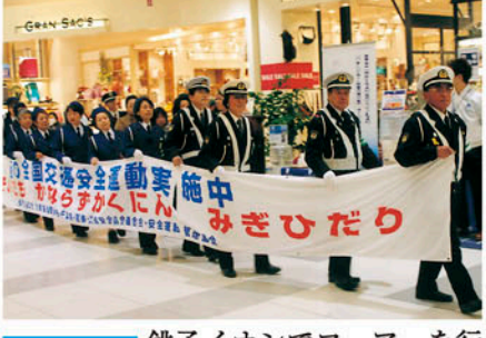
銚子 銚子イオンでフェアを行い館内をパレードする。