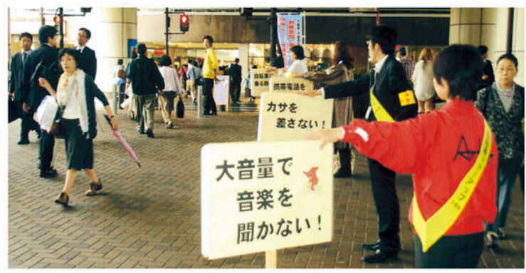
プラカードでも広報

昨年、県内で自転車に乗って22人。今年は5月21日現在で既に11人の方が亡くなっています。気軽に乗れる自転車ですが、ルールとマナーを無視すると重大事故につながります。 交通安全協会では、自転車の事故防止を今年の活動の重点と位置付け、子どもや高齢者を対象にした自転車交通安全教室を県下各地で開催しています。 「自転車も 安全速度と 気配りを」を自覚し、自転車利用マナーアップを図りましょう。