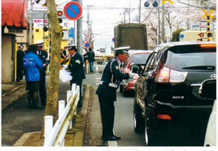
流山 江戸川台の踏切で安全通行を呼びかける。