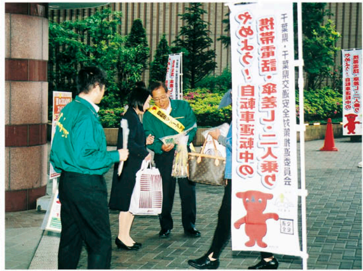
啓発物を配り自転車の安全利用を呼びかける

この日は県や市、県警、県交通安全協会、県安全運転管理協会、県交通安全母の会連合会などの交通関係者約40人が参加。雨上がりの午後、駅利用者や買