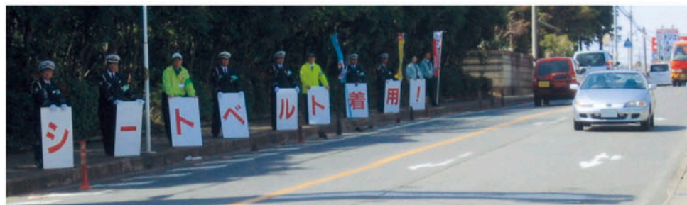
佐倉交通安全協会