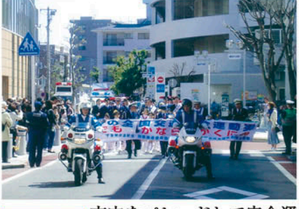
我孫子 市内をパレードして安全運動の周知を図る。