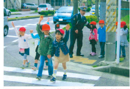
千葉西 高洲第四小学校で道路横断の実地指導を行う。