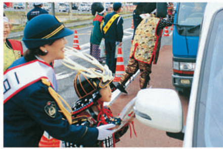
大多喜 国道298号で手作り甲冑隊が参加し広報を行う。