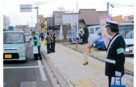
茂原 茂原公園入口交差点で啓発物を配り安全運転を訴える。