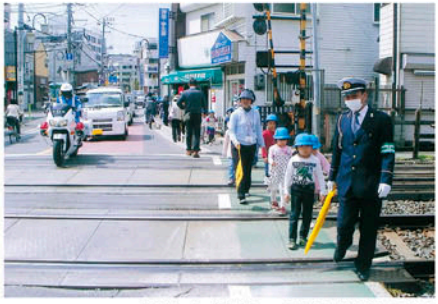
船橋 葛飾小学校の新入学児が通学路を歩く実地体験をする。