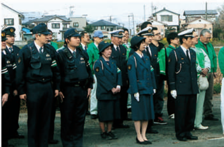
鴨川 市役所で安全運動に伴う出動式を行う。