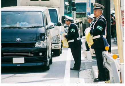
市川 国道14号で交通事故死ゼロを目指す日の活動を行う。