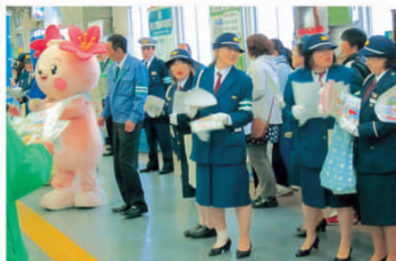
君津 君津駅で飲酒運転追放等のキャンペーンを行う。