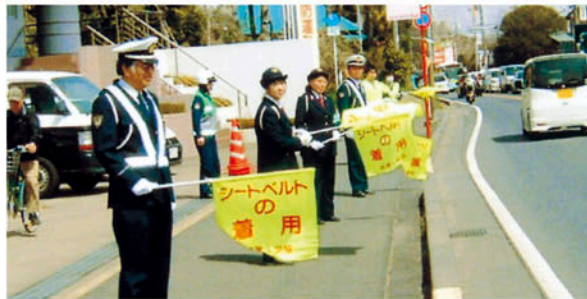
鎌ヶ谷交通安全協会