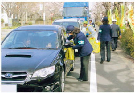
八千代 幹線道路で一声かけながら交通事故防止を呼びかける。