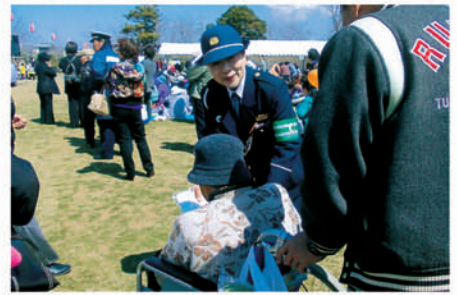
旭 袋公園の桜祭り会場で啓発物を配り無事故を訴える。