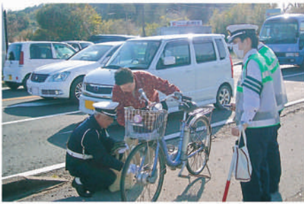
館山 市内稲交差点で自転車に反射材を取り付け啓発する。