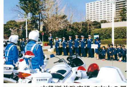
千葉南 市役所前駐車場で市内5署合同の出動式を実施する。