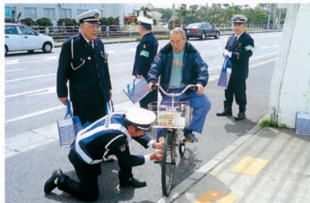
木更津 市内潮見の道路で反射材を取り付ける啓発活動を行う。