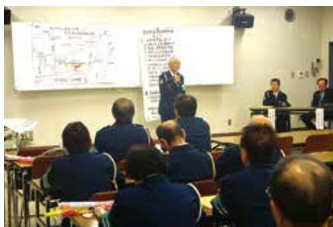
交通指導員による事例発表 (12月9日・松戸東金会場)