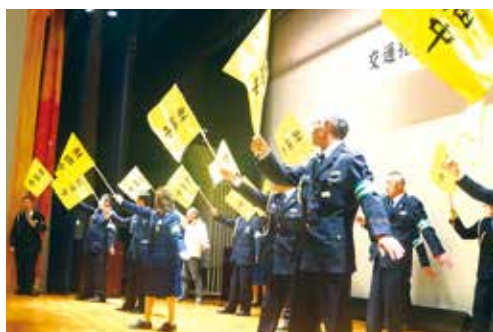
横断旗の使い方を学ぶ交通指導員 (12月12日・市原会場)