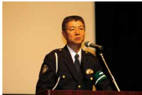
千葉県警察本部担当官による交通安全活動の実施要領の講話 (12月3日・東金会場)