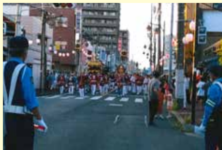
野田 夏祭りに伴う雑踏警戒