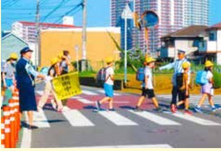
佐倉 通学路における街頭監視・安全誘導活動