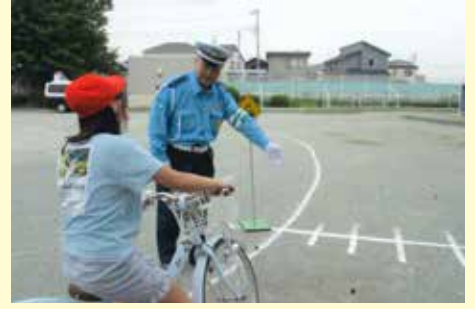
千葉中央 小学生を対象とした自転車安全教室