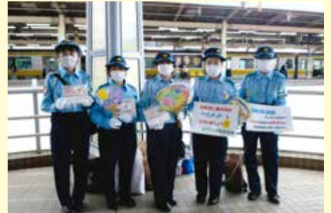
船橋 船橋フェイス通路における交通安全キャンペーン