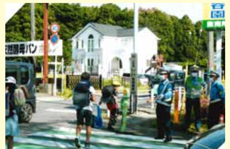
鎌ヶ谷 通学路における街頭監視・安全誘導活動