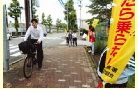
千葉東 千城台高校前における自転車マナーアップ活動