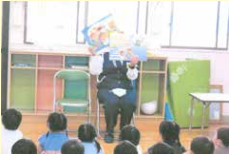
東金 児童を対象とした交通安全教室