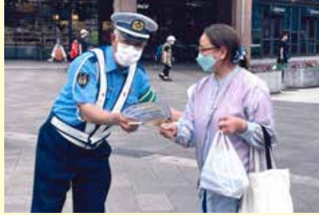
浦安 飲酒運転根絶キャンペーン