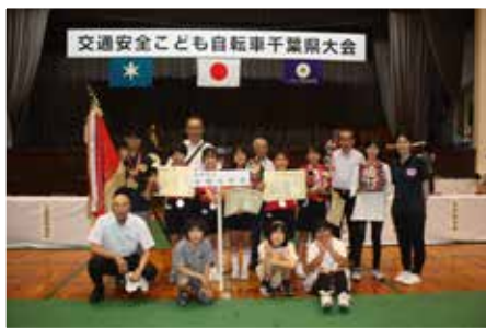
▲ 優勝した松戸市立中部小学校の皆さん