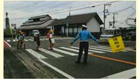
大多喜 朝の通学児童に対する安全誘導活動