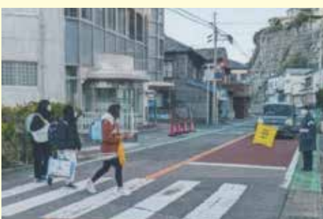
勝浦 通学路における安全誘導活動の実施