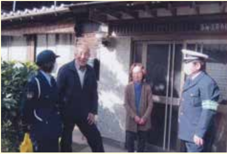
成田 高齢者の自宅訪問による交通安全指導の実施