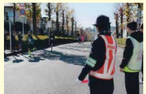
八千代 ロードレース大会開催に伴う交通誘導活動の実施