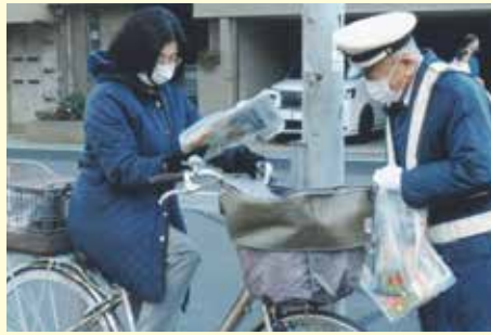
市川 駅前周辺における交通安全キャンペーンの実施