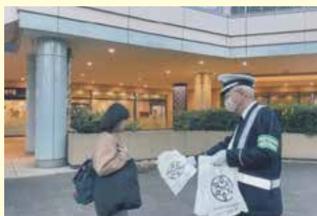
浦安 駅前における交通安全キャンペーンの実施