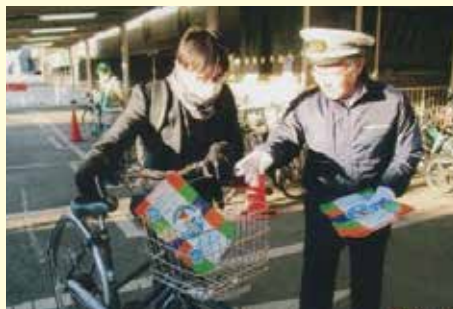
行徳 駅頭における自転車ヘルメット着用キャンペーンの実施