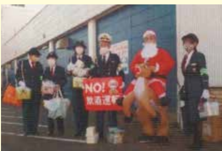
いすみ 商業施設における交通安全キャンペーンの実施