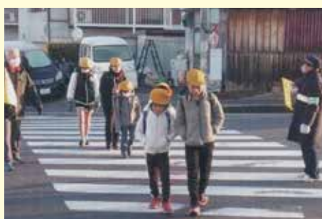
佐倉 通学路における安全誘導活動の実施