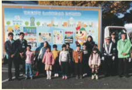
鎌ヶ谷 交通安全ポスター等をラッピングしたトラックの運用