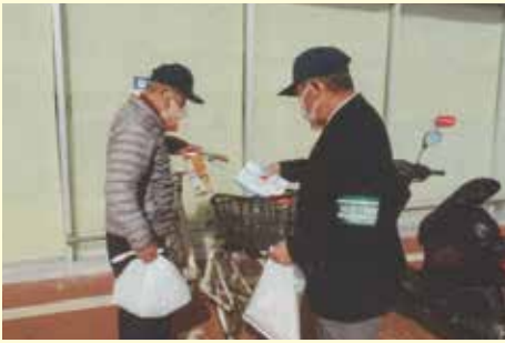
銚子 商業施設における自転車ヘルメット着用キャンペーンの実施