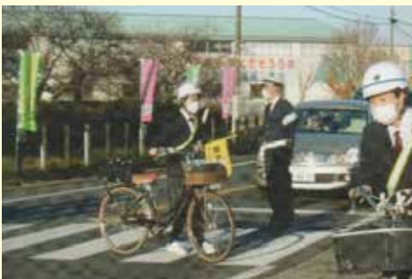
茂原 役場入口交差点における安全誘導活動の実施