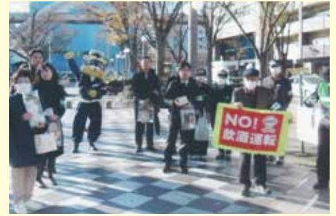
千葉中央 サインプレート等を活用した飲酒運転根絶活動の実施