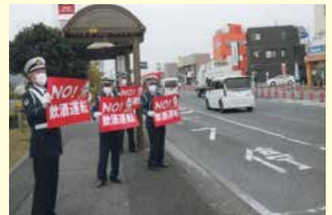
千葉北 サインプレートを活用した飲酒運転根絶活動の実施