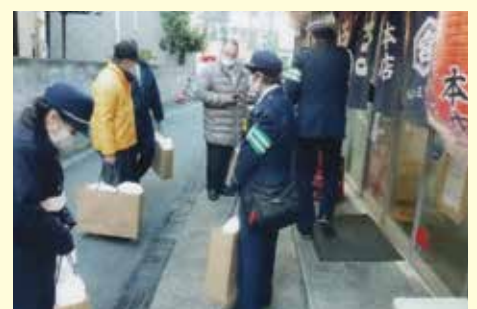
船橋 酒類提供店に対する飲酒運転根絶キャンペーンの実施