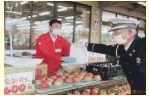
千葉東 商業施設におけ交通安全キャンペーンの実施