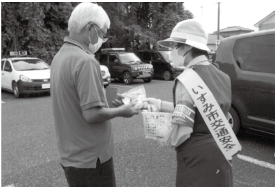
い す み

9月20日、成田警察署において開催された「秋の全国交通安全運動出動式」及びキャンペーンに参加して、交通事故の防止を呼びかけた。