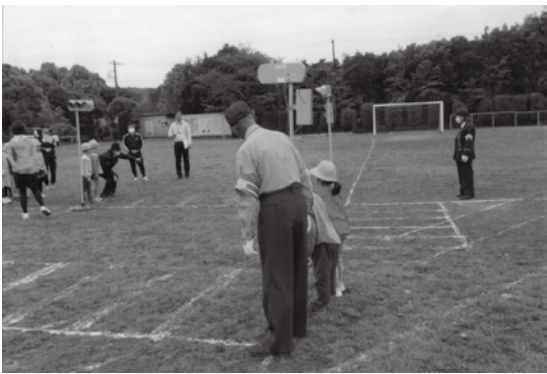
い す み

5月29日、佐倉市千成村公民館において「交通安全教室」を開催し、自転車保険の加入と自転車用ヘルメットの着用を呼びかけた。