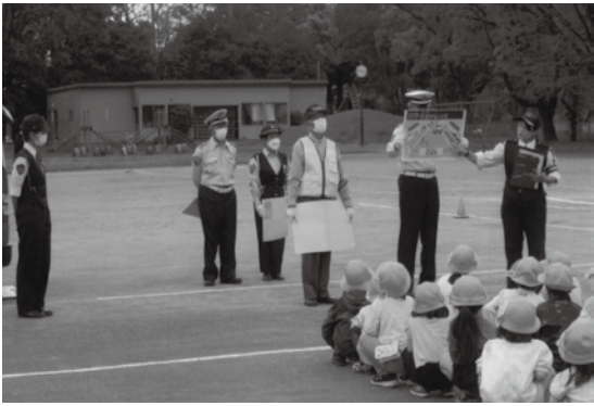
四 街 道